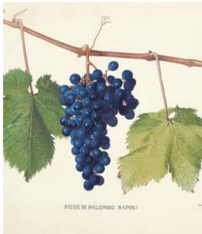
Ampelografia Piede di Palombo, da Ampelografia italiana, 1882

Coloratissime e a piena pagina sono le immagini scelte come accompagnamento estetico. Le copertine di alcune riviste disponibili in Biblioteca, tutte della prima metà del se-