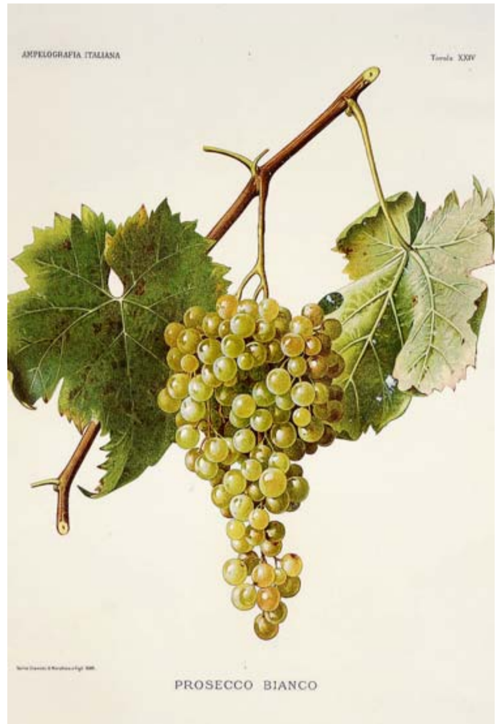
Prosecco Bianco, da Ampelografia italiana, 1882, a cura del Comitato centrale ampelografico