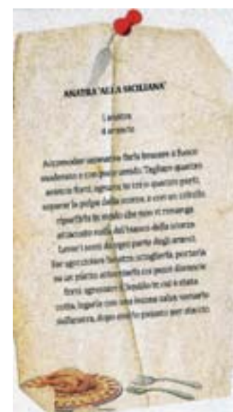
Almanacco Gastronomico, 1915

Un inno al lavoro e un riconoscimento alla fatica, ma anche una valorizzazione dei frutti sono i messaggi veicolati dalle splendide illustrazioni ottocentesche dai colori vivi di concessa all'azienda VCR da "La Vigna", che sono solo un assaggio del vasto patrimonio consultabile in materia vitivinicola: è del 1661 infatti l'Ampelographia del tedesco Philipp Jacob Sachs, opera in cui per la prima volta compare il nome di questa materia tanto studiata; dal '600 in poi, per chi volesse approfondire o scoprire le origini e le curiosità del mondo vinicolo, c'è solo l'imbarazzo della scelta. ♦