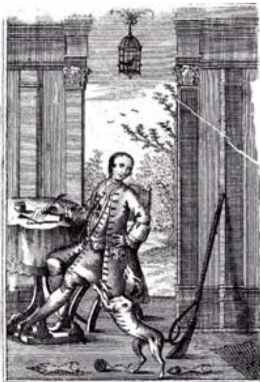
Il ritratto del roccolista al lavoro