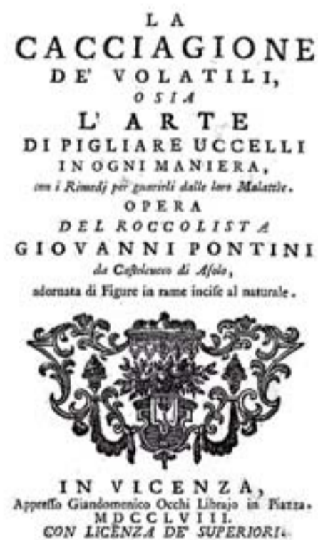
Il frontespizio del volume sull'arte di "pigliare" gli uccelli

go tutto il recinto circolare. All'interno di quest'area fra cespugli, fronde e piante basse venivano occultate le gabbiette contenenti gli uccelli da richiamo.