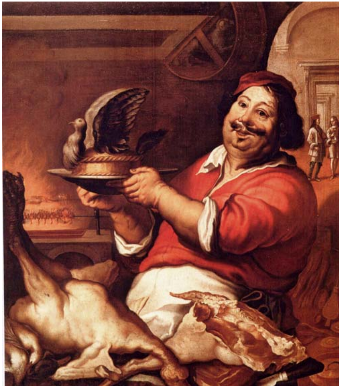
Joachim Von Sandrart: Cuoco con pasticcio, XVII sec. Il pasticcio è un assemblaggio tra elementi naturali e trasformazione culinaria

specie, che continuano a rimanere segno di distinzione sociale, delle salse agrodolci, delle carni di volatili e delle frattaglie, del pesce, delle verdure e dei legumi, delle paste ripiene, tutti alimenti già presenti nell'alimentazione medievale. Rispetto al Medioevo notiamo una predilezione per le carni di manzo e di tacchino e per i latticini. Anche il pomodoro, la zucca, i fagioli e il mais vengono apprezzati soprattutto nel Veneto. La grande novità