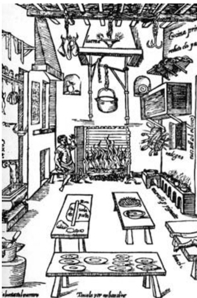
Dall'Opera di Bartolomeo Scappi (1570): la cucina

mite dello spreco (ne sono testimonianza le continue leggi contro il lusso emanate dalle città italiane durante questo secolo) ad aver prodotto l'idea di un'alimentazione completamente diversa da quella in uso nell'“ascetico” Medioevo. Come spesso accade con le epoche d'oro della storia umana, anche la celebrazione dei fasti rinascimentali porta con sé il rischio dell'idealizzazione e dell'oblio dei debiti nei confronti del passato. ♦