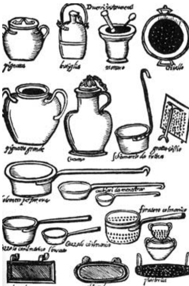
Un'altra tavola dedicata agli strumenti da cucina