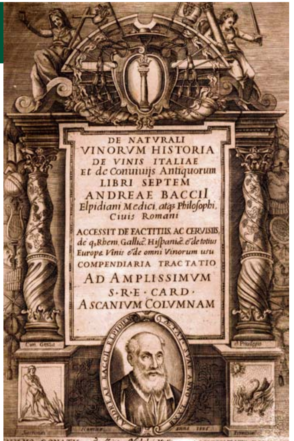
Andrea Bacci, nel suo volume (riprodotto qui sopra) paragona le feste in villa a quelle degli antichi romani

Candelieri d'argento, mentre le tovaglie erano dei più pregiati lini e tessuti di Fiandra