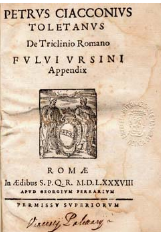
Gli allestimenti cinquecenteschi nulla avevano da invidiare a quelli raccontati da Pedro Chacon nel suo "De triclinio romano" del 1588, opera conservata nella Biblioteca "La Vigna" di Vicenza