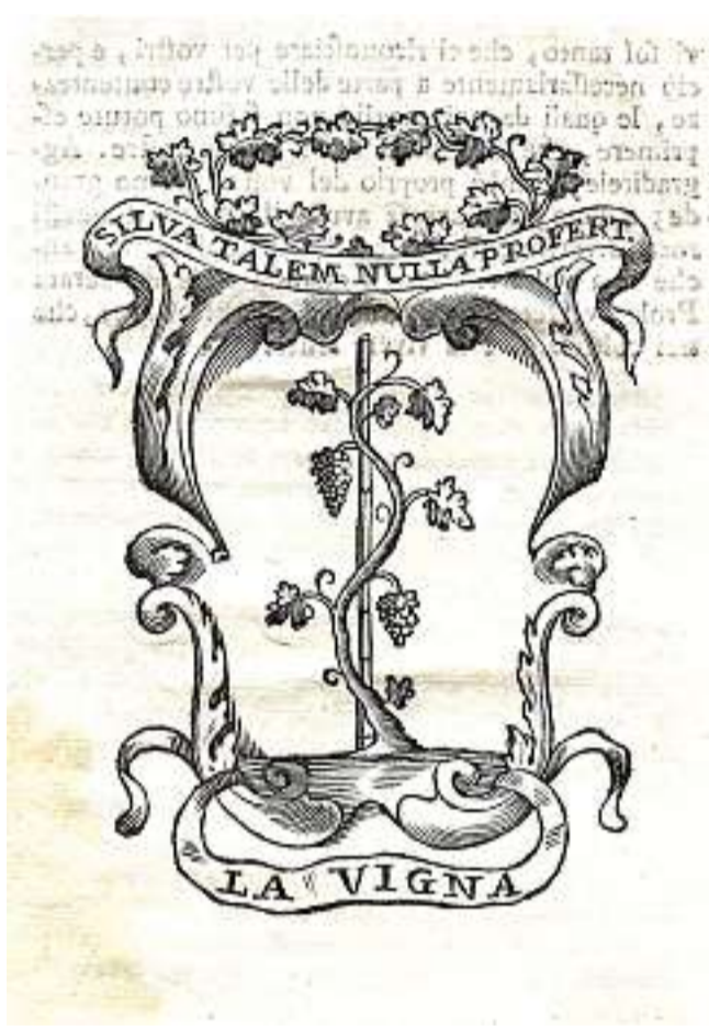
Il simbolo degli accademici ferraresi, che oggi è diventato il logo della Vigna. Eccolo riprodotto in una pagina del libretto del 1725

Quello stemma era stato originariamente pensato per l'Accademia della Vigna, fondata a Ferrara nel 1724 da Girolamo Baruffaldi, poeta e letterato, appassionato di storia e di archeologia. I soci dell'Accademia, detti Vignaiuoli, usavano riunirsi frequentemente per