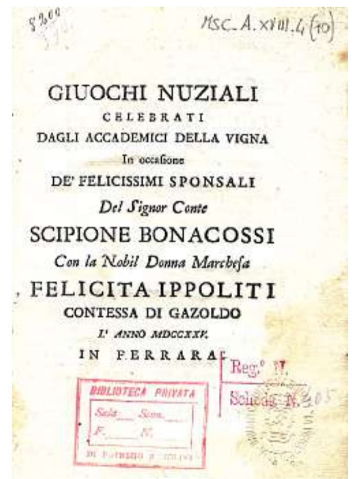
La copertina del libretto del 1725 degli accademici de "La Vigna" ferraresi: fu edito per le nozze dei nobili Bonacossi - Ippoliti

Il motto dello stemma, stampato mediante silografia sulla sesta pagina, riproduce un verso del "Pange Lingua", un inno