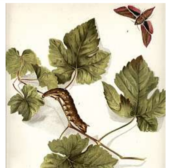
La sphinx, un'altra larva distruttiva delle piante. Le tavole furono realizzate da Anna Bauler, che riproduceva dai vivi i parassiti

torno al millimetro di colore giallo - ocra, originario dell'America settentrionale e accidentalmente importato in Europa nella seconda metà del XIX secolo: nel Vecchio Continente devastò quasi ovunque le colture attaccandone l'appa-