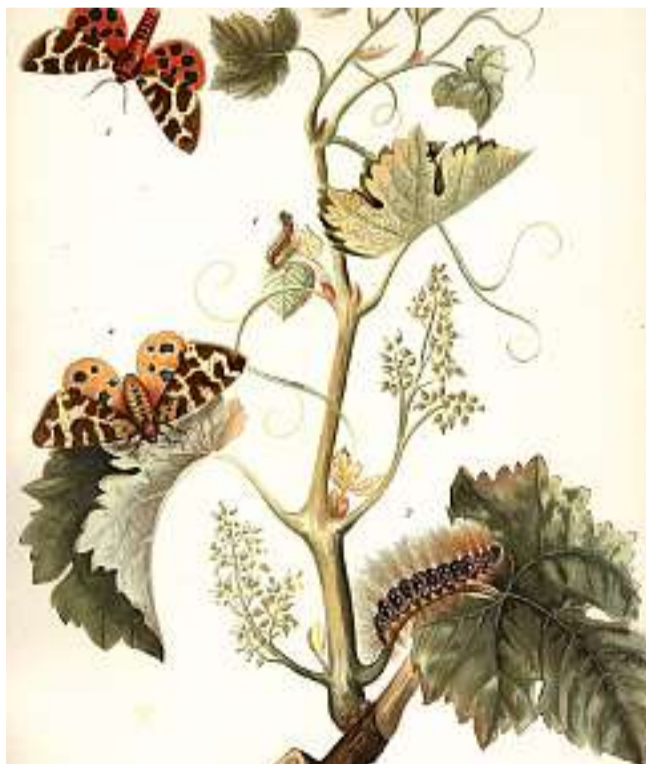
L'arctia, una farfalla dalle notevoli dimensioni e dai bellissimi colori che da larva si nutre delle foglie degli alberi da frutto, distruggendoli

Nessuna dissertazione scientifica, ma semplicemente una guida chiara e immediata e molti consigli pratici sulla lotta agli "invasori": è quello di cui avevano bisogno i viticoltori del tempo, gente a volte poco pratica di manuali, ma che ben sapeva usare gli attrezzi del mestiere. "Imparare subito e imparare abbastanza" è quello che l'autore si propone di fare nella prefazione. L'opera si divide in due parti