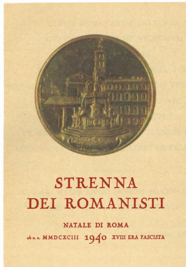
Facsimile della copertina della prima «Strenna»