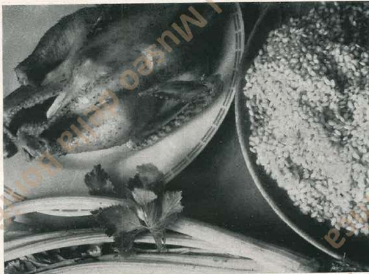
In questa «inquadratura» di un angolo di tavola da cucina c'è già qualche buon numero di un classico programma di pranzo di Natale. Una tacchina di media grandezza (sono le migliori per gusto e tenerezza), un piatto di grani di riso (riso grosso e sodo, di buona famiglia) e un sedano dalle lunghe costole poipose e dalla fogliolina verde che pare di sentirne il profumo. - Sotto si vedono altri due piatti di riso cotto, ma nessuno dei due «alla milanese», su tavole bene apparecchiate.

Non è difficile, dagli esempi zoologici, discendere agli etnografici. Il lurido levantino che si spidocchia al sole sulla porta del suk , non assaggerebbe una porzione di maiale per tutto il paradiso delle url. Ma la più raffinata delle ladies , dalla carne di giglio e dagli occhi di viola, non esterebbe a inghiottire due dozzine di ostriche vive; assai più schifose, se ci pensate, d'una porzioncina di fojolo , ben lavata e cotta a dovere. Insomma le identità tra alimenti e alimentati, anche qui, sono difficili da stabilire. Perché può darsi che l'inglese arso e rossiccio rassomigli alquanto al suo beefsteak ; che il bavarese roseo e tondo si ricordi un pochino della sua salsiccia; che la viennese, dalla pelle morbida e dal cuore di zucchero ripeta in certo modo la struttura del suo küchel e del suo strudel ; che la facezia modenese sia compatta e grassa come la mortadella; che quella piemontese sia pastosa e filante come la fondua . Ma guardatevi bene, trascinati dagli esempi, dal pensare che il genio milanese sta nel risotto allo zafferano; o che lo spiritus della busecca si ripete in quello di Carlo Porta. o